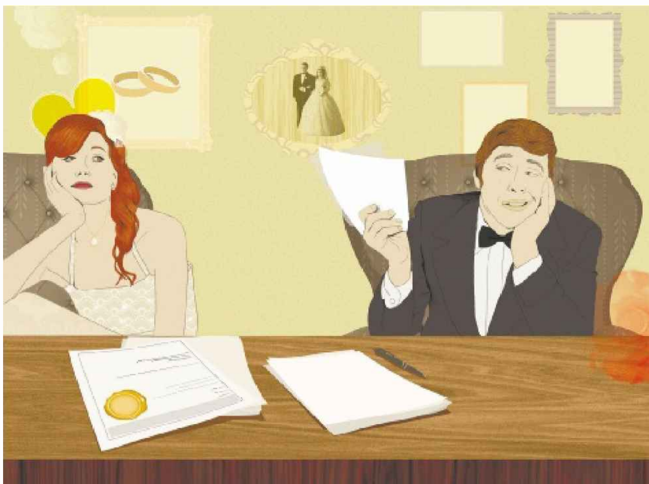
איור: שרונה גונן

• לא מומלץ להשתמש בהסכמי ממון סטנדרטיים שאפשר למצוא ברשת. "היו לא מעט מקרים שאנשים ניסו